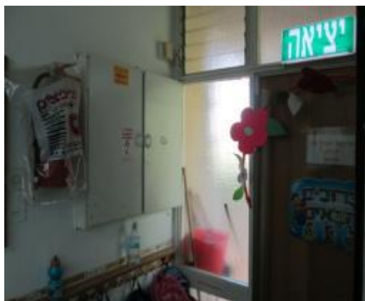
תמונה 2 : אולם הגן